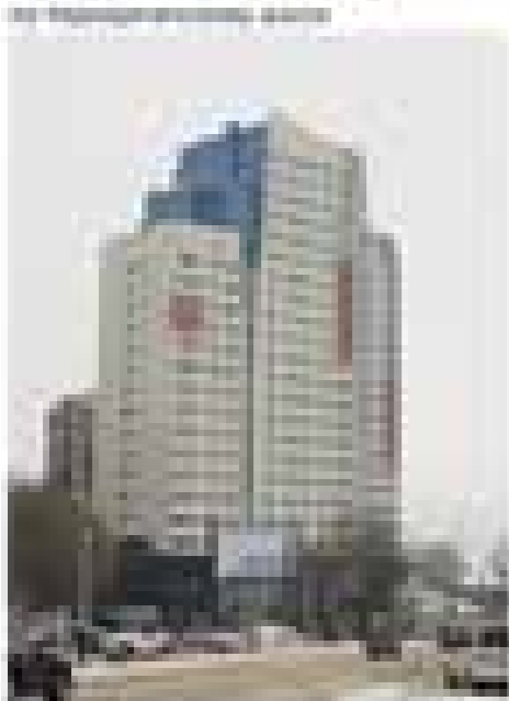
Многоэтажный корпус школы