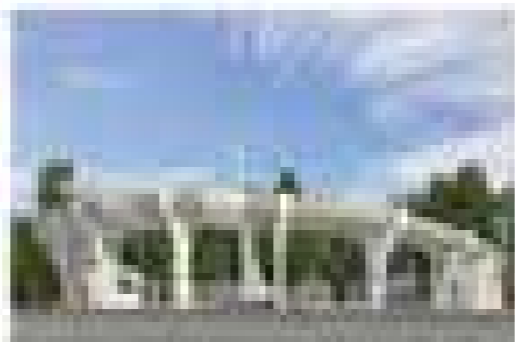
Новый корпус школы №1 в г. Хабаровске

ООО «ДВПИ» выполнило проектирование здания школы №1 в г. Хабаровске. Проект школы выполнен в соответствии с требованиями к современным школам.