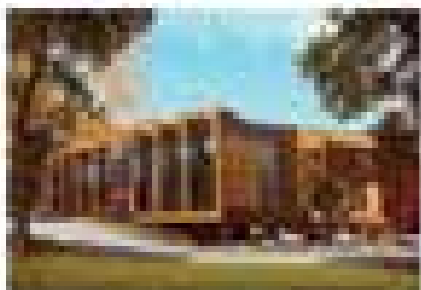
Новый многоэтажный корпус школы

За годы работы компания благодаря высокому профессионализму и творческому подходу сотрудников в нашем городе появилось много новых, интересных и значимых объектов.