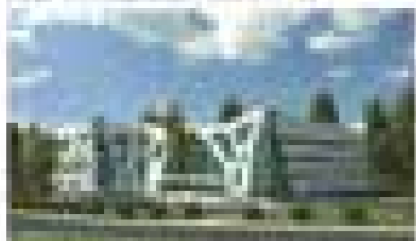
Проектирование здания в г. Хабаровске