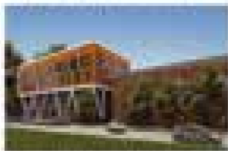
Проектирование здания школы №1 в г. Хабаровске