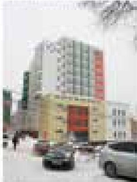
Новый корпус школы №1 в г. Хабаровске